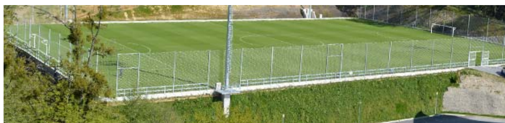
Nuevo Campo de fútbol Z2. Zubieta // 2016