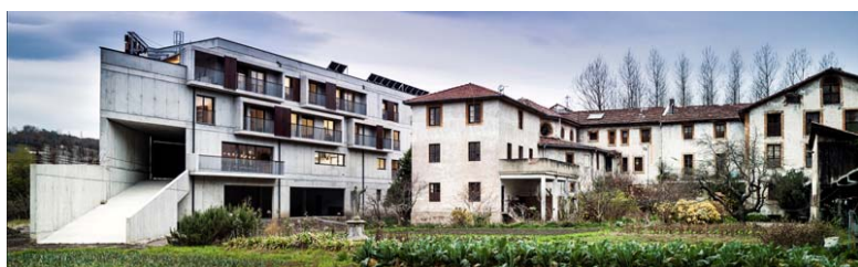
NUEVO ALA DEL CONVENTO KRISTOBALDEGI